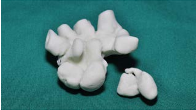
/ Abb.: Am ETHIANUM wurde, erstmals in der Geschichte der Handchirurgie, das Handgelenk eines Patienten als 3-D Modell entwickelt, um einen mikrochirurgischen Korrekturingriff optimal vorzubereiten. Links sehen Sie das Modell des Handgelenks, rechts das zerstörte Kahnbein als Nachbildung