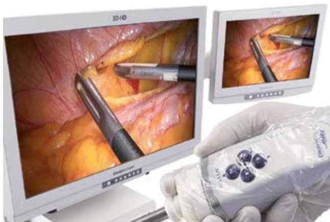
/ Abb.: Das robotergestützte 3-D System für gynäkologische Operationen im Bauchraum ermöglicht die präzise Darstellung der Strukturen im Bauchraum, z. B. bei Gebärmutterentfernung, Eierstockentfernung oder Tumoroperationen

2012 führte er die weltweit erste Eierstockentfernung durch den Magen durch.