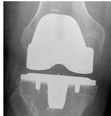
/ Nach Implantation einer Kniegelenk-Totalendoprothese: Man sieht die beiden Metall-implantate, dazwischen das Kunststoff-Inlay

Welches Vorgehen empfiehlt sich für Sie persönlich? Vereinbaren Sie einen Untersuchungstermin unter 06221 8723-160