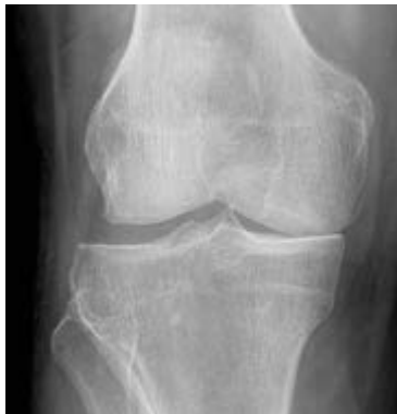
/ Fortgeschrittene Kniegelenk-arthrose, der innere Gelenkspalt ist fast nicht mehr vorhanden (rechte Bildhälfte)